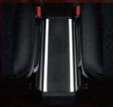
センターフロア トレイルミ