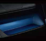
インパネアッパートレイルミ (助手席)