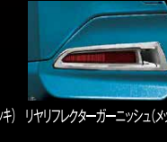
リヤリアクターガーニッシュ(メッキ)