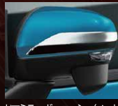
ドアミラーガーニッシュ(メッキ)