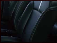
レザー調×ファブリックシート表皮 (グレーステッチ/撥水加工)