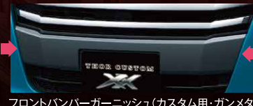
フロントバンパーガーニッシュ(カスタム用・ガンメタ)