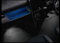
フットイルミ(運転席・助手席)