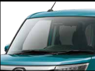
トップシェイドガラス