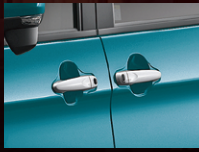
メッキドアアウターハンドル