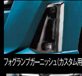
フォグラブガーニッシュ(カスタム用・メッキ)